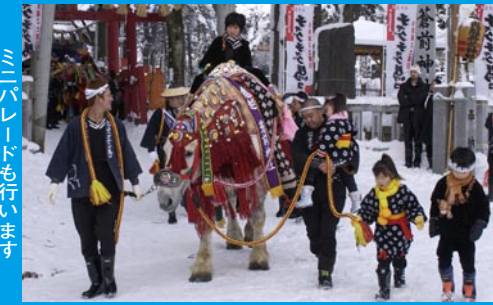
ミニパレードも行います