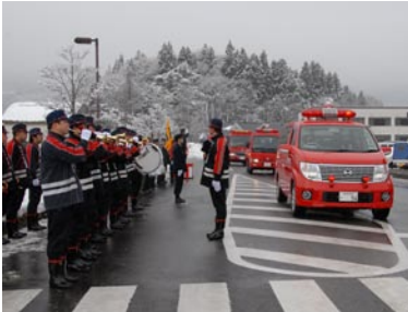
火消しの心意気を披露します