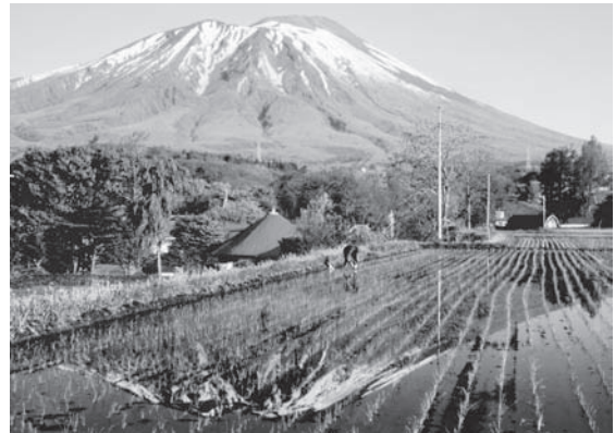
昨年度の最優秀賞作品「早朝のひととき」

応募作品には、部門名、題名、氏名、年齢、住所、職業、電話番号、撮影年月日、撮影場所などを記入し、平成19年2月9日（金）までに、滝沢村観光協会（〒020-0192 鶴飼字中鶴飼 55 滝沢村役場 商工観光課内 内線267）に応募してください。