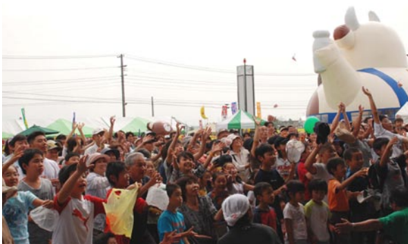
毎年恒例のもちまきにはたくさんの皆さんが参加します (上)、牛乳早飲み大会など各種イベントを開催します (下)