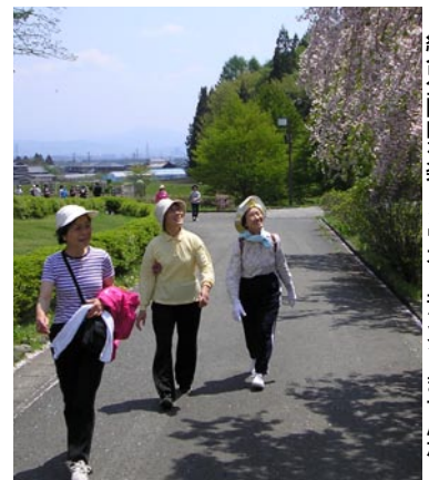
総合公園内を楽しくウォーキングしませんか