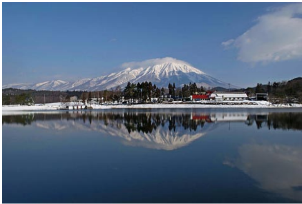
ふるさとの象徴・岩手山 (写真上=第 14 回 観光写真コンクール入選作品から) と村の名前の由来になっている滝の沢 (写真下)

ふるさとを離れ県外で生活している皆さんとの交流を深めながら地域の活性化を図るために、県外在住者を会員とする「(仮称) 滝沢ふるさと会」の設立に向け準備を進めています。