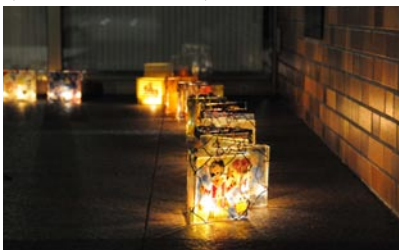
昨年のキャンドルナイトには、みたけの園の皆さんによる「夢あかり」も参加